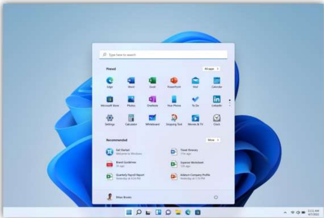
Windows 11 작업 표시줄 및 시작 메뉴의 Microsoft Edge 아이콘.

가장 쉬운 방법은 리디렉션을 기다리지 않고 지금 바로 Microsoft Edge 사용을 시작하는 것입니다. Windows 를 사용 중인 경우, 시작 메뉴에서 Microsoft Edge 를 열거나 바탕 화면 또는 작업 표시줄의 아이콘 을 클릭해 Microsoft Edge 를 열 수 있습니다. Windows 11 작업 표시줄 및 시작 메뉴의 Microsoft Edge 아이콘을 클릭해 Microsoft Edge 를 열 수 있습니다.